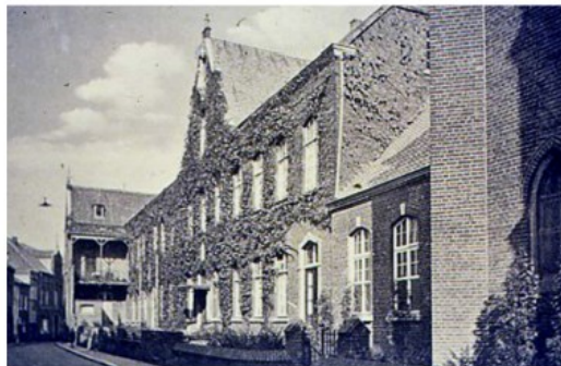
Het voormalige St. Josephgasthuis aan de Begijnengang. Het oude Venlose ziekenhuis aan de Begijnengang voor de verwoesting in de Tweede Wereldoorlog.